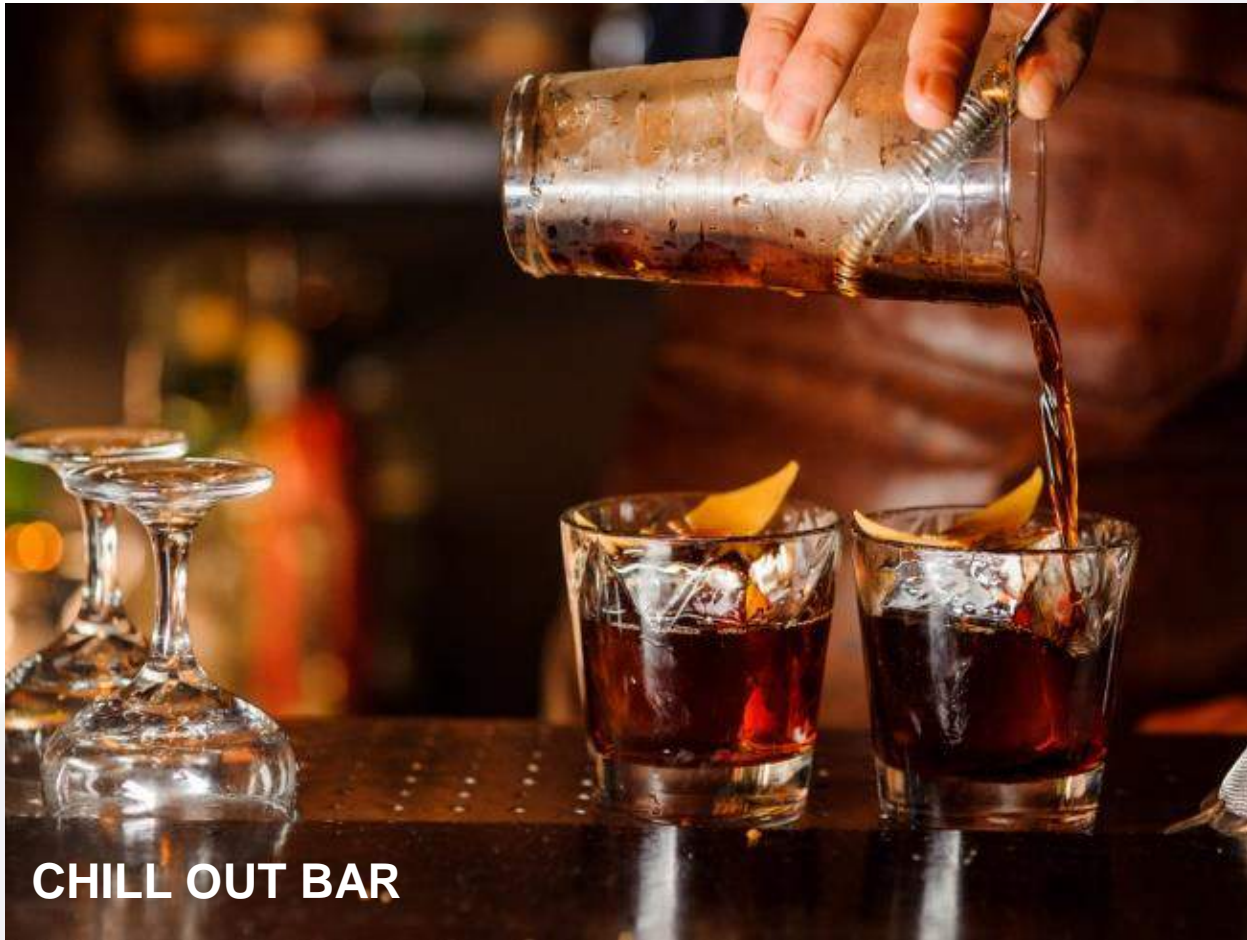
CHILL OUT BAR