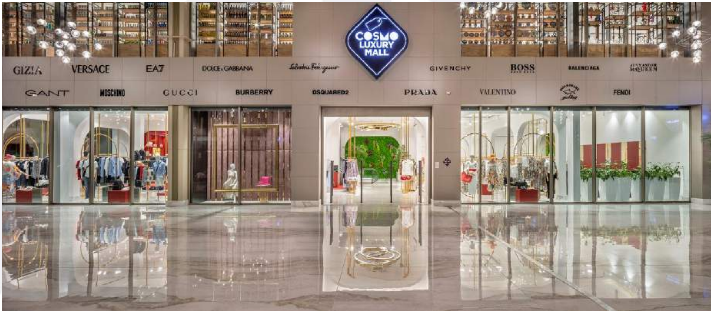
Торговый Центр высокого класса в лобби