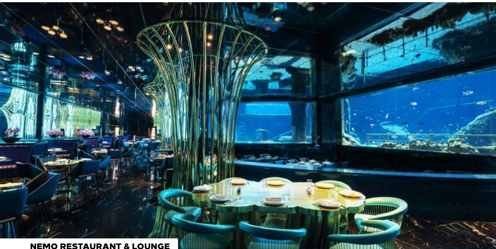
NEMO RESTAURANT & LOUNGE