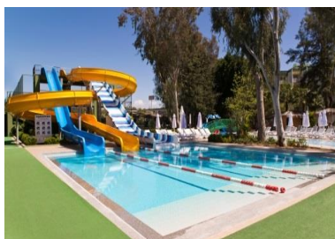
Бассейн с горками 2