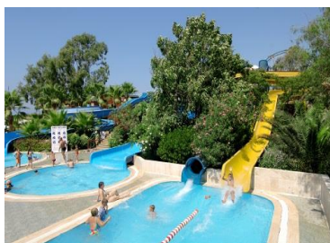
Бассейн с горками 1