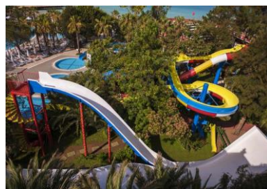
Бассейн с горками 3