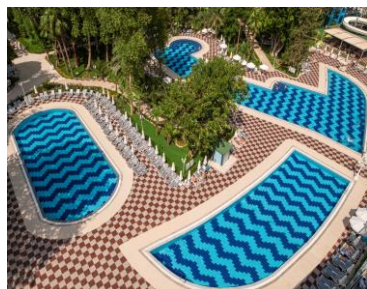
Бассейн 3, 4, 5