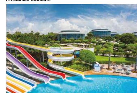
Бассейн в аквапарке