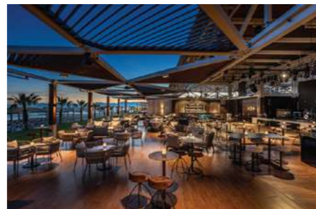
Charm Beach Club