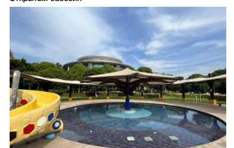
Открытый детский бассейн