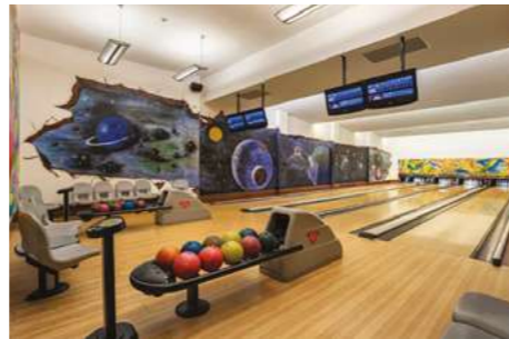
Зал для боулинга