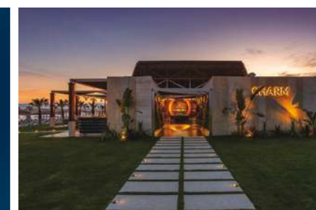
Charm Beach Club