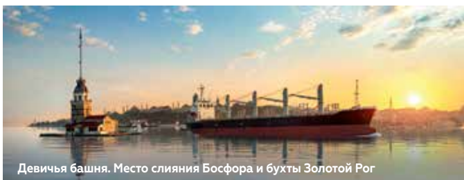
Девичья башня. Место слияния Босфора и бухты Золотой Рог

Залив Золотой Рог принято считать одной из самых красивых естественных гаваней в мире, по форме напоминающей рог. Во время захода солнца пролив сияет золотым светом.